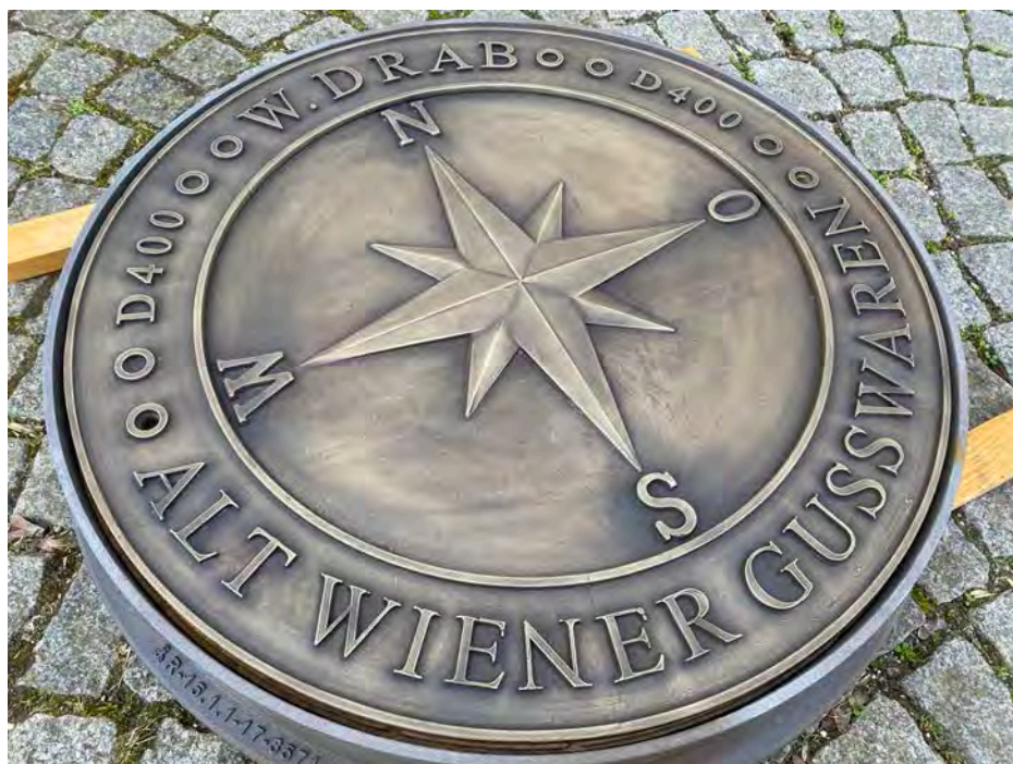
Art.: 19620 Schachtabdeckungen "Windrose" rund DN600 ohne Ventilation. D 400 kN Rahmen aus Gusseisen, Deckel aus Gusseisen mit einer Bronzauflage braun patiniert Deckel Lichte Weite: 610 mm